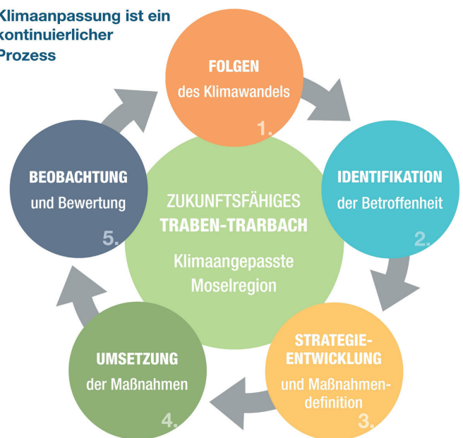
Abb.: Klimaanpassung ist ein kontinuierlicher Prozess (Eigene Darstellung nach Zentrum KlimaAnpassung, 2022)

Klimaanpassung ist ein kontinuierlicher Prozess