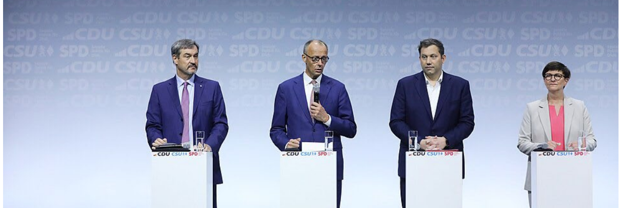
Unterzeichnung des Koalitionsvertrages 2025 der 21. Wahlperiode des Bundestages.

hat er wenig Spielraum, um Führung zu demonstrieren. Er tritt eher als Koalitionskanzler auf, nicht als jemand mit ausgeprägter Führungsstärke, was zu seinen niedrigen Zustimmungswerten beiträgt.