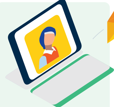
Digitale Erreichbarkeit in einem geschützten Rahmen

Die sog. Leiter der Partizipation graduieren acht Beteiligungsformen, die von lediglich vorgetäuschten Mitsprachemöglichkeiten bis hin zu möglichst autonomen und selbstgeführten Formaten reichen (vgl. Abb. Seite 12). 6