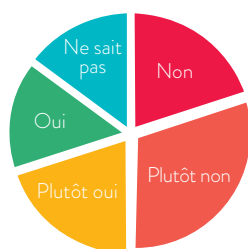
Élèves par les délégué(e)s de classe