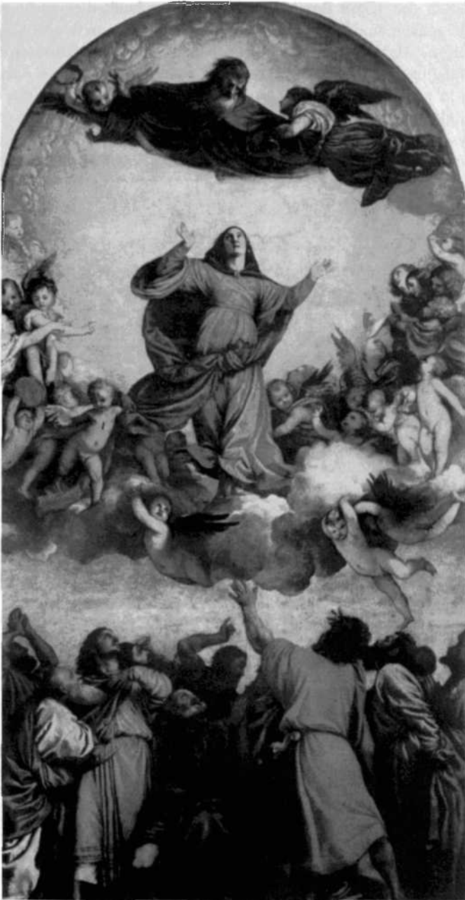
Abb. 2: Tizian, Mariae Himmelfahrt, Venedig, Sta. Maria dei Frari-Kirche.