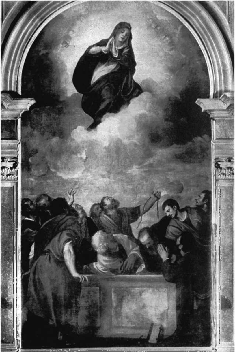
Abb. 1: Tizian, Gürtelspende Mariens, Verona, Dom.